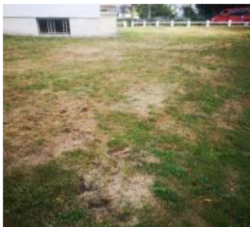
Clôture remise en place et accès par la propriété

Suite à la pose de cet épi, les travaux de la tranche 1 ont été réceptionnés.