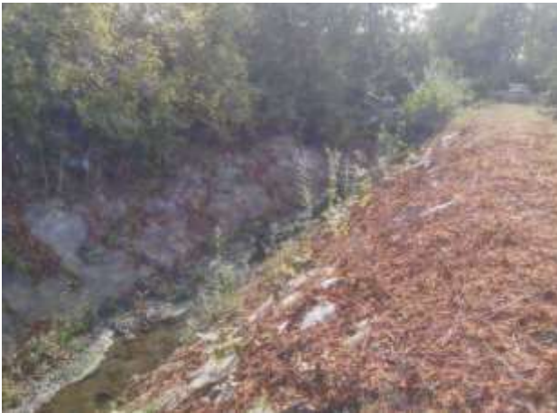
Secteur de renouée fauché

L'entreprise a procédé à la fauche des foyers de renouée du Japon pour la deuxième fois de l'année. Cependant quelques plants n'ont pas été fauchés. L'entreprise reviendra très prochainement sur site afin de faucher ces quelques plants. Ensuite, l'entreprise procédera aux deux dernières fauches de l'année en septembre puis fin octobre - début novembre.