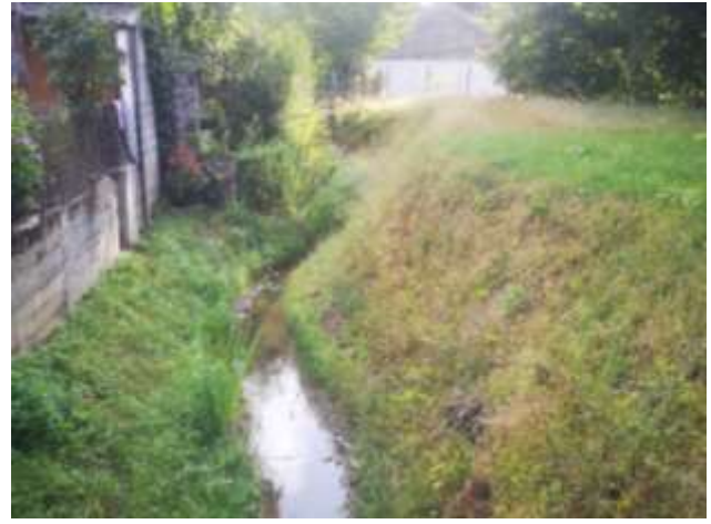
Entretien moyen du lit – avant et après travaux

Les branches basses de certains arbres et arbustes qui pouvaient limiter les écoulements en période de hautes eaux ont été coupées et exportées.