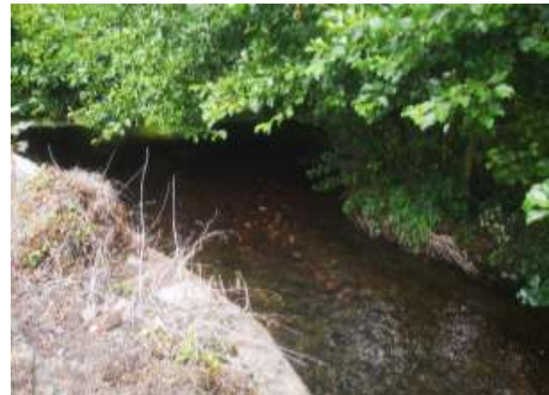
Gestion des branches basses – avant et après travaux

Sur les zones où des plantations d'arbres et arbustes ont eu lieu, l'entreprise a fauché les abords afin de permettre à ces plantations de pousser plus facilement. Cependant, il a été constaté la perte de nombreux plants suite à la canicule de ces derniers jours.