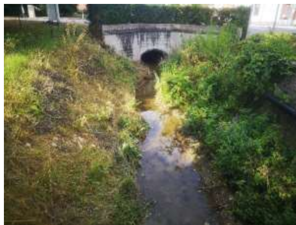
Faucardage important du lit – avant et après travaux

Les orties, chardons et ronces présents en berges ont été retirés et exportés.