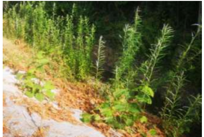
Plants de renouée non fauchés