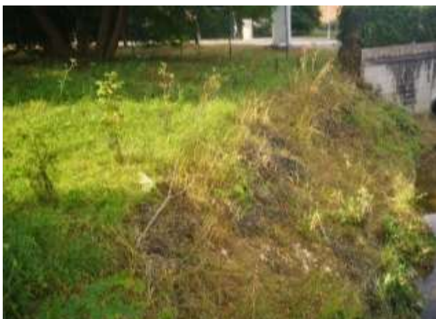
Fauche autour des plants d'arbustes

Sur les zones où des plantations d'arbres et arbustes ont eu lieu, l'entreprise a fauché les abords afin de permettre à ces plantations de pousser plus facilement. Cependant, il a été constaté la perte de nombreux plants suite à la canicule de ces derniers jours.