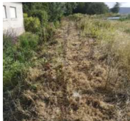
Nombreux plants d'arbustes morts suite à la canicule