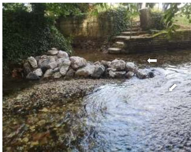
Epi mis en place – vues amont et aval