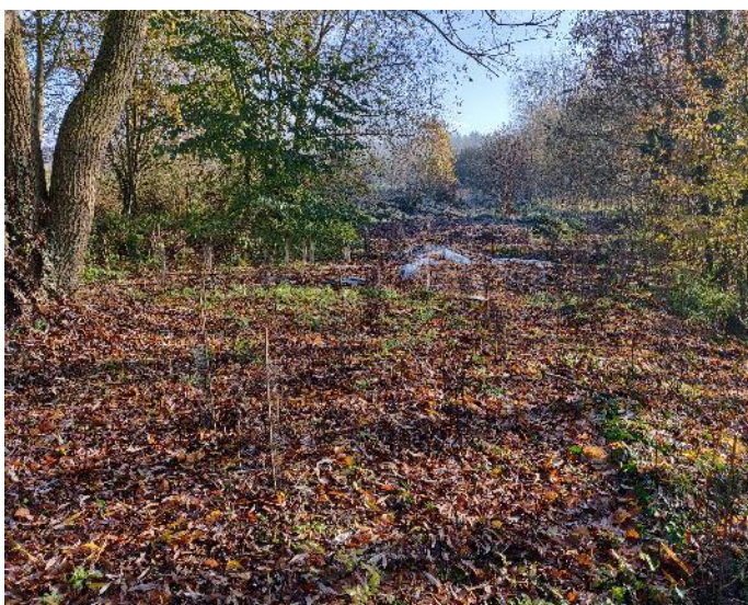
Fauche de la Renouée du Japon et plantation en forte densité