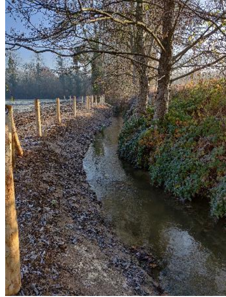
Talutage des berges en pente douce et mise en place d'une clôture