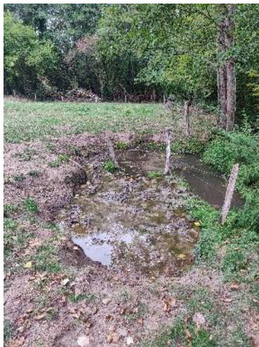
Descente sauvage, piétinement des berges, avant travaux