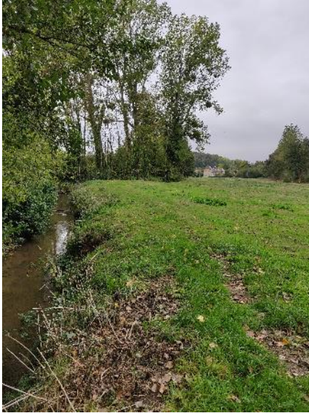
Berges dégradées et merlon de curage, avant travaux