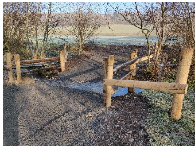
Mise en place d'un passage à gué