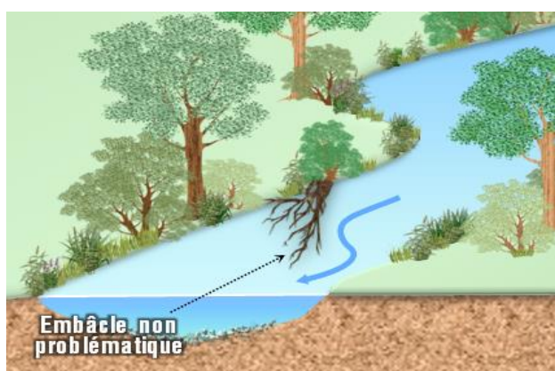
Embâcle non problématique