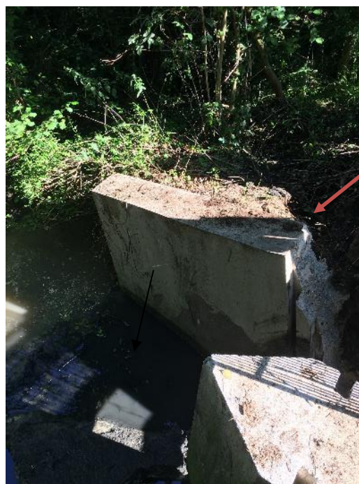
Pile de l'ouvrage déstabilisée