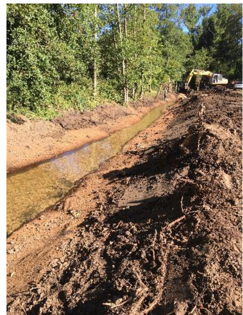
Création de banquettes et mise en place d'un géotextile en fibre de coco