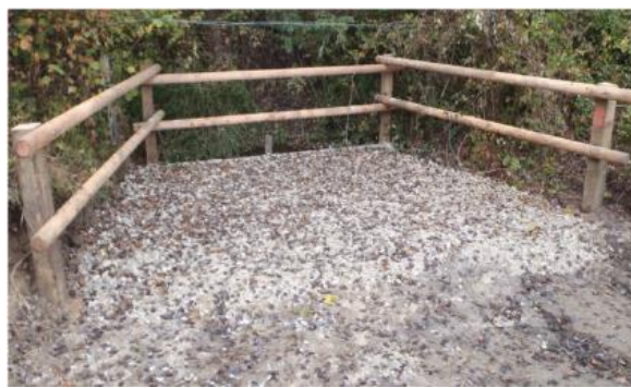
Exemple d'un passage à gué et d'un abreuvoir rustique