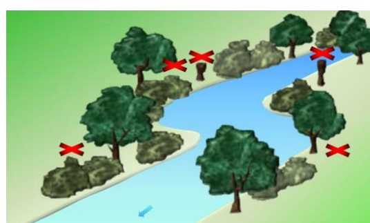
Après gestion sélective : Ripisylve pluristratifiée