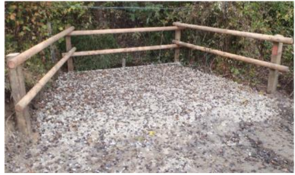
Exemple d'un passage à gué et d'un abreuvoir rustique