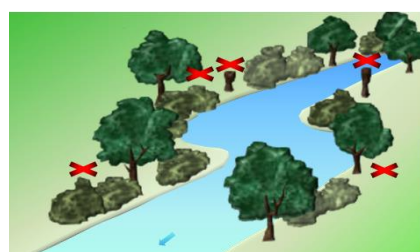
Après gestion sélective : Ripisylve pluristratifiée