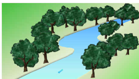
Ripisylve monostratifiée + individus du même âge