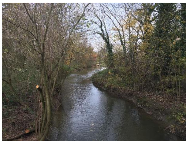
Sélection végétative et ouverture du milieu, tronçon OMCB