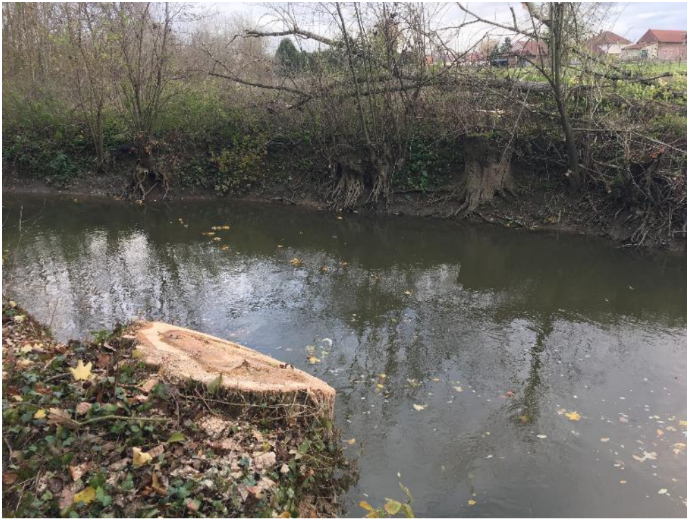
Abattage d'un peuplier jugé dangereux, tronçon OMCB