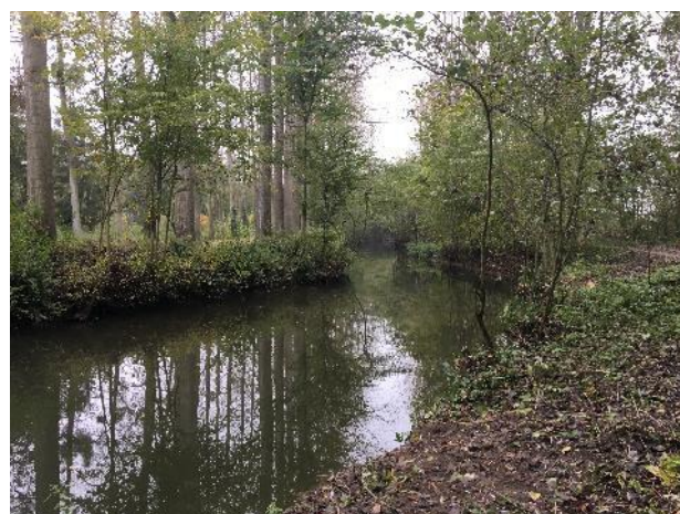
Sélection végétative et ouverture du milieu, tronçon OMBZ