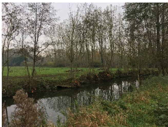
Recépage des taillis, tronçon OMBZ