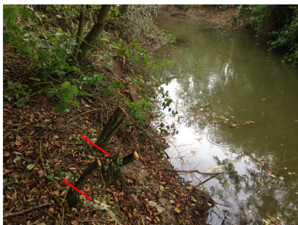
Recoupe des arbustes à reprendre