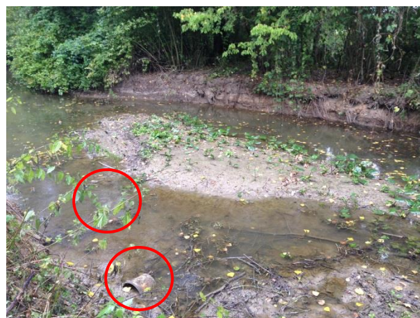
Déchets oubliés dans le lit (à retirer)