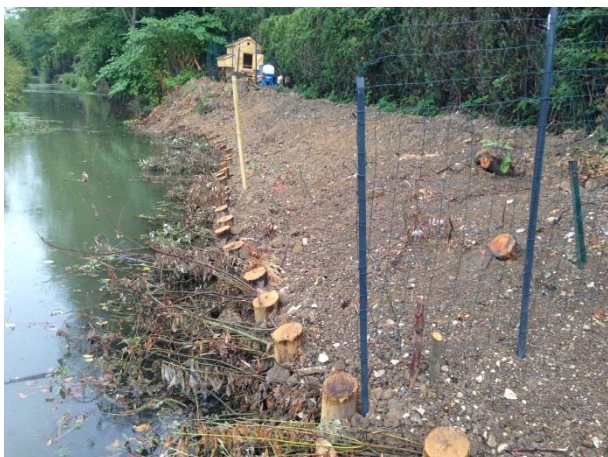
Aménagement de berge réalisé : peigne