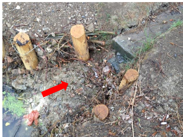
Pierres à disposer en aval du caniveau pour limiter l'érosion