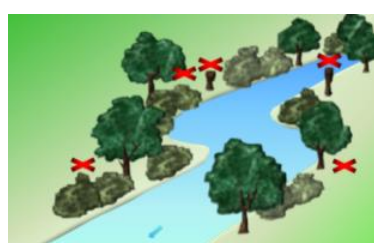
La sélection végétative permet de diversifier les différentes strates d'âges et d'espèces ligneuses.