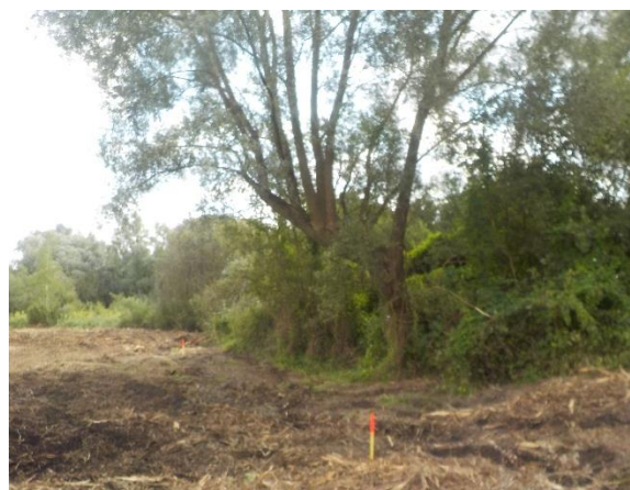
Jalons de piquetage (haut de berge rive gauche) et arbres à conserver