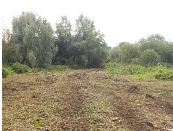
Débroussaillage du site au droit du futur tracer de l'Ardon

Au vu du plan des travaux, des jalons ont été disposés tout le long du nouveau tracer de l'Ardon sur environ 1 000 m, matérialisant ainsi le haut de berge en rive gauche du nouveau lit. Les jalons n'ont pas été implantés à distance régulière mais en fonction des méandres du nouveau tracer.