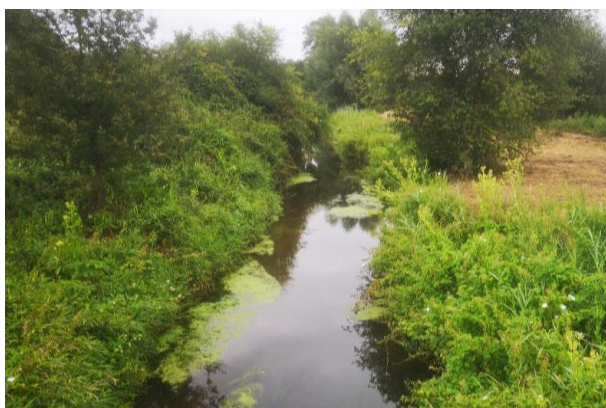
L'Ardon actuel suite à son recalibrage

Au vu du succès rencontré, le syndicat a décidé d'être encore plus ambitieux en poursuivant ces travaux de reméandrage sur un linéaire beaucoup plus important. L'opération globale de reméandrage est prévue sur l'Ardon et une petite partie de l'Ailette sur un linéaire avoisinant les 7 km, afin que l'Ardon retrouve un caractère plus naturel sur la majeure partie de son cours.