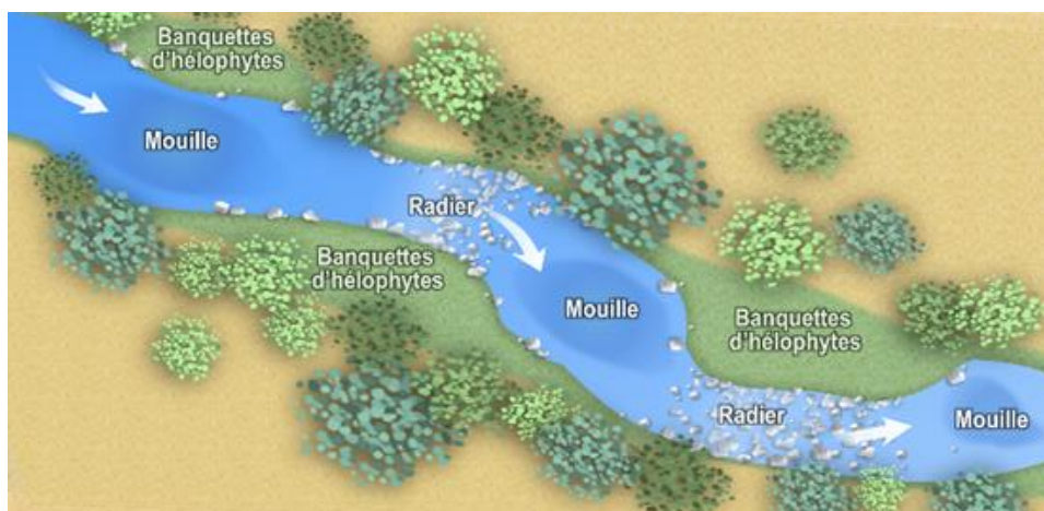
Schéma type de l'hydromorphologie du nouveau lit

La largeur de la base du lit est en moyenne de 3 m, mais variera de ± 0.5 m en fonction des zones de mouilles, plus larges, et des zones de radiers, plus resserrées. La largeur plein bord pourra varier de 7 à 8 m en fonction de la pente des berges. Les sinuosités du lit et des berges seront assez marquées et aucun aménagement ne devra avoir un aspect anguleux afin de donner l'apparence la plus naturelle possible, conformément au schéma ci-dessous :