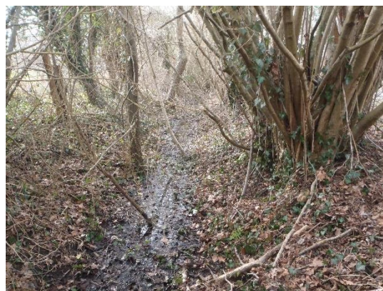
L'ancien lit de l'Ardon