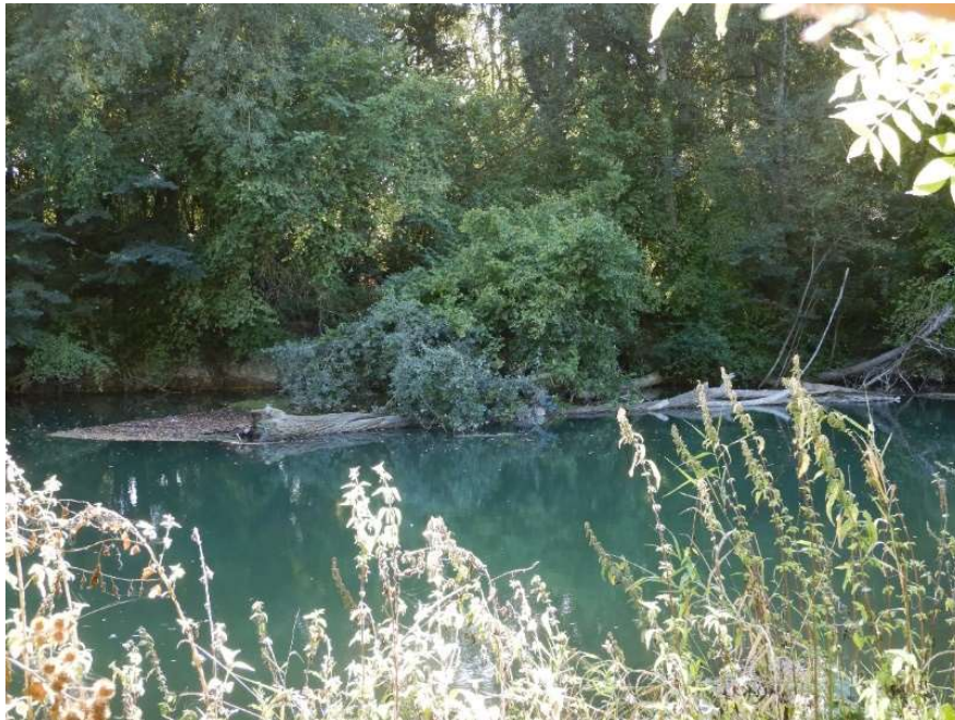
Embâcles en face du camping de Guignicourt