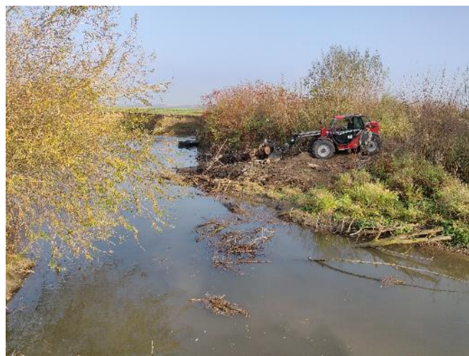
Retrait de l'embâcle en cours de réalisation