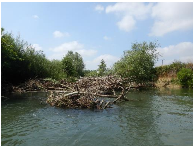
Embâcle n°1241 en amont du pont de Dercy

L'embâcle n° 1241 jugé problématique et véritable frein au bon écoulement des eaux a été entièrement retiré et stocké en retrait du haut de berge.