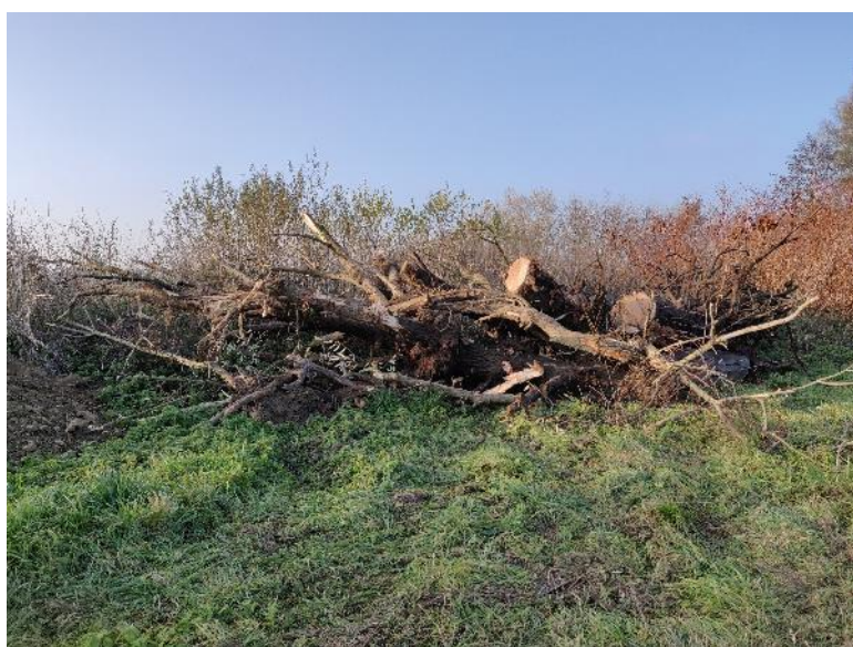
Bois retiré de la Serre suite à l'intervention d'ATENA PAYSAGE (Volume > 10 m 3 )