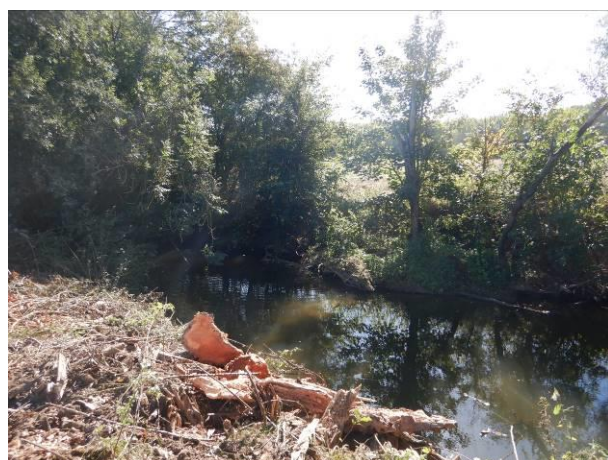
RETRAIT EMBACLE SUR LA COMMUNE DE VINCY