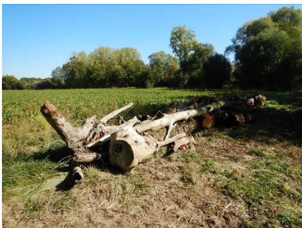
BOIS MIS EN TAS A DESTINATION DES PROPRIETAIRES