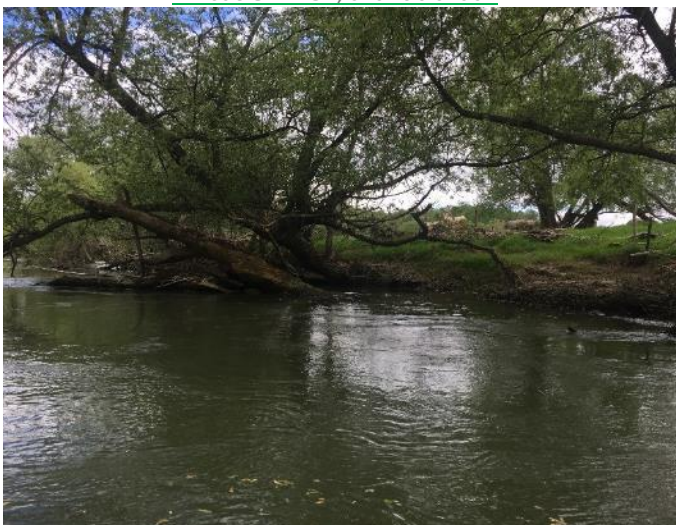
Embâcle N°141, avant travaux