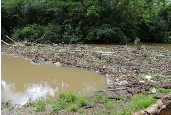
Embâcle à Evergnicourt, avant travaux