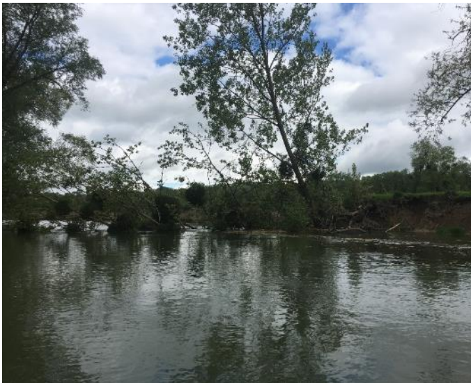
Embâcle N°137, avant travaux

Ces embâcles sont jugés problématiques pour le bon écoulement des eaux et seront donc retirés par l'entreprise.