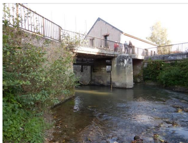
OUVRAGE D'AGNICOURT ET SEHELLES : AVANT ET APRES TRAVAUX