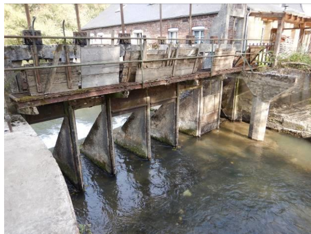
OUVRAGE D'AGNICOURT ET SEHELLES : AVANT ET APRES TRAVAUX