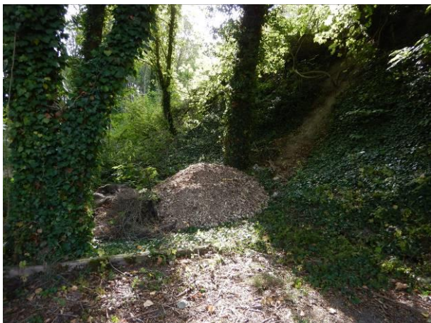
COPEAUX DE BROYAGE