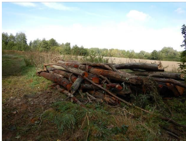
MISE EN TAS DES GROS BOIS EN HAUT DE BERGE