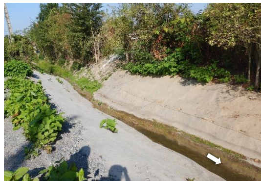
Foyers de Renouée : fauche et mise place d'un géotextile