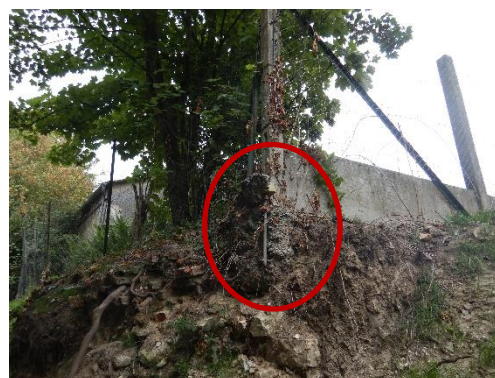
Borne à consolider (béton)

Des plantations d'arbustes sont également prévues sur certains secteurs. Leur piquetage sera réalisé en novembre, période propice pour leur implantation.