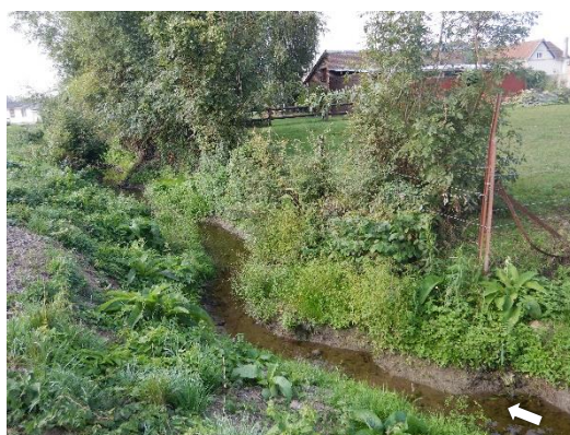
Lit sinueux avec banquettes végétalisées