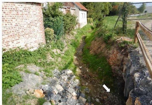
Pont dalot et renforcement de berges