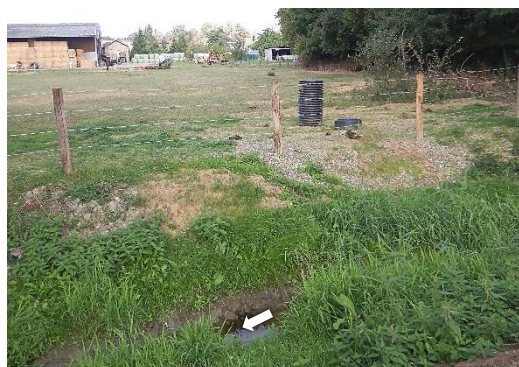
Clôture et abreuvoir