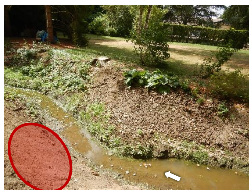
Zone sur laquelle des boutures de saules pourront être implantées