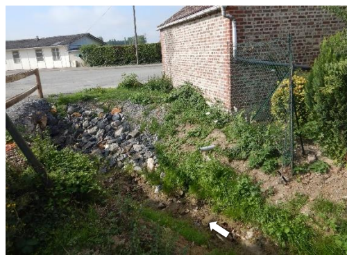
Secteurs sur lesquels des hélophytes seront implantées

Des boutures de saules seront également implantées sur les secteurs où se situent actuellement les foyers de renouée afin de leur faire concurrence. Des boutures seront aussi mise en place sur des berges susceptibles de subir à termes un risque d'érosion (tronçon intermédiaire).