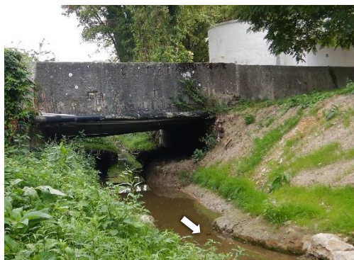
Hydrocurage du lit sous le pont et de la section busée