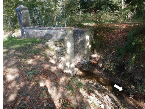
Suppression du radier