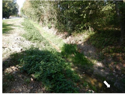
Lit sinueux avec banquettes végétalisées