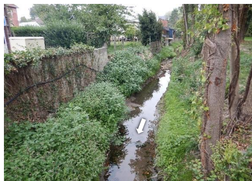
Lit sinueux avec banquettes végétalisées