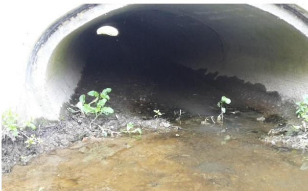
Sédiments en excès sous le passage busé