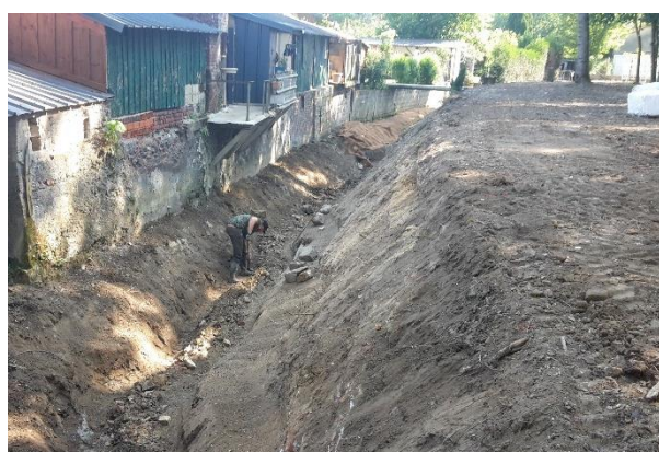
Reprofilage du lit en cours de création

Des banquettes en pieds de berges de largeur différentes ont été créées, là où cela était possible, afin de permettre l'implantation des plantes hélophytes (iris, joncs, carex, ...).