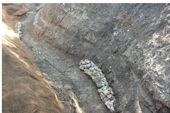
Pierres disposées en rive concave

Des pierres, déjà présentes sur site, ont été réutilisées afin de diversifier le fond du lit et recréer des habitats favorables à la vie aquatique. Ils sont principalement disposés au niveau des rives concaves afin d'éviter d'éventuelles érosions de berges.