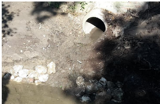
Empierrement à réaliser à la sortie du réseau d'eau pluviale

Des sédiments sont également présents en excès sous le pont et la partie busée. Leur retrait s'avère donc nécessaire. L'entreprise Forêt & Paysages fournira rapidement au maître d'ouvrage le coût du retrait de ces sédiments par hydrocurage.