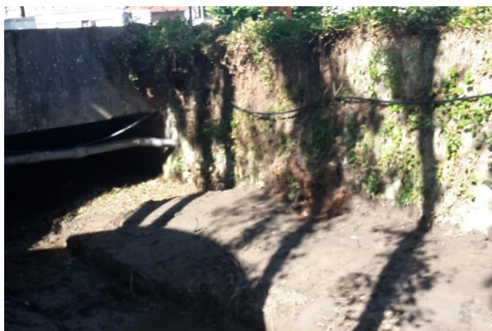
Réparation temporaire de la conduite d'eau potable

L'entreprise Forêts & Paysages a poursuivi les travaux de reprofilage du lit de l'amont vers l'aval. Un tracé sinueux a été réalisé pour retrouver l'aspect d'un cours d'eau plus naturel, en décalant le lit légèrement en rive gauche. La berge de cette même rive a été talutée en pente plus douce afin de garantir sa stabilité.