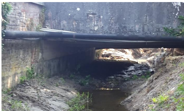
Sédiments en excès sous le pont

Des sédiments sont également présents en excès sous le pont et la partie busée. Leur retrait s'avère donc nécessaire. L'entreprise Forêt & Paysages fournira rapidement au maître d'ouvrage le coût du retrait de ces sédiments par hydrocurage.