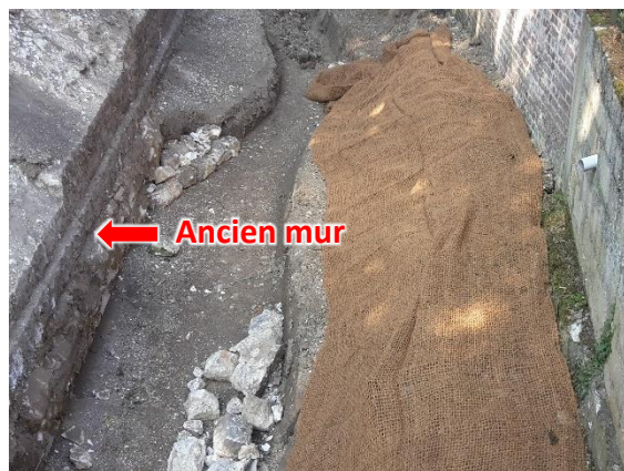
Géotextile en train d'être installé et ancien mur du château conservé

Des pierres, déjà présentes sur site, ont été réutilisées afin de diversifier le fond du lit et recréer des habitats favorables à la vie aquatique. Ils sont principalement disposés au niveau des rives concaves afin d'éviter d'éventuelles érosions de berges.