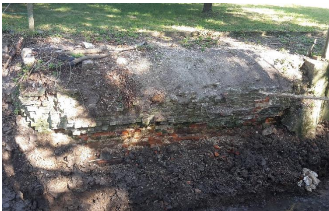
Mur en briques à habiller de terre et à végétaliser

Le dernier mur en brique présent avant le pont (rive droite) sera conservé en état car sa stabilité n'est pas remise en cause. Il sera habillé de terre puis végétalisé. A chaque sortie de réseau d'eau pluviale, un empierrement libre sera réalisé afin de casser la force d'une arrivée d'eau brutale et limiter ainsi le risque d'érosion.