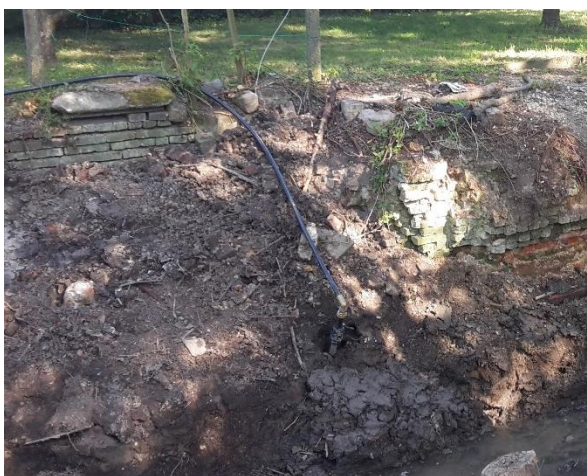
Conduite d'eau potable sortant de la berge

Une conduite d'alimentation d'eau potable, ne figurant pas sur la DICT (déclaration d'intention commencement de travaux) et traversant le ru sans être profondément ancrée dans le fond du lit, a été endommagée par l'entreprise. Le service gestionnaire d'adduction de l'eau potable (Noréade) est rapidement intervenu afin de rétablir l'alimentation en eau. De nouveaux travaux sur cette conduite seront réalisés prochainement par ce même prestataire afin soit de la remettre dans le fond du lit soit en aérien au niveau du pont.