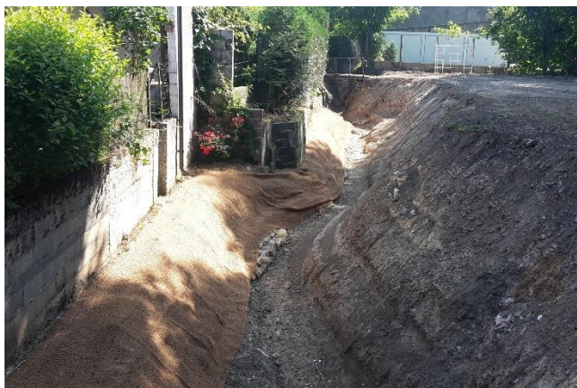
Géotextile le long des habitations

Un géotextile biodégradable en fibres de coco est en train d'être installé le long du pied des habitations afin de garantir la stabilité des berges et des fondations le temps de la reprise des végétaux.