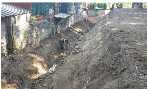
Travaux en cours plus en aval

Les travaux de reprofilage du lit et des berges se poursuivent la semaine 27 plus en aval jusqu'au pont puis jusqu'au passage busé. Le lit y sera également le plus sinueux possible, des banquettes seront créées en pieds de berges qui seront talutées puis végétalisées.