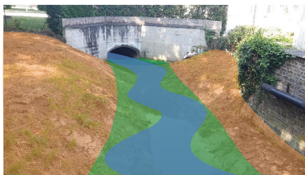
Schéma du reprofilage des berges et de la création d'un lit sinueux et de banquettes