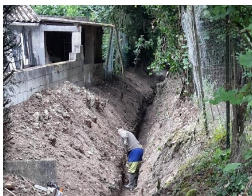
Même secteur après retrait des débris et des thuyas

Les travaux de reprofilage du lit se sont poursuivis de l'amont vers l'aval. Le lit du ru a été approfondi de 50 à 60 cm afin de retrouver la même cote de fond que celle du bras de l'Oise. Un tracé sinueux a été réalisé pour retrouver l'aspect d'un cours d'eau plus naturel, en décalant le lit légèrement en rive gauche. La berge de cette même rive a été talutée en pente plus douce afin de garantir sa stabilité. Le haut de la berge a ainsi été reculé de 1 m à 1,50 m conformément avec ce qui a été convenu avec le propriétaire.