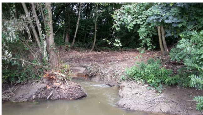
Berges à taluter puis végétaliser

Au niveau du bras de l'Oise, 3 ou 4 microseuils empierrés (chute d'eau < 20 cm) seront implantés préférentiellement sur le bras de contournement afin de rehausser la lame d'eau et garantir l'alimentation en eau de l'étang présent en rive gauche. Les berges de l'ancien ouvrage seront talutées en pente douce puis végétalisées.