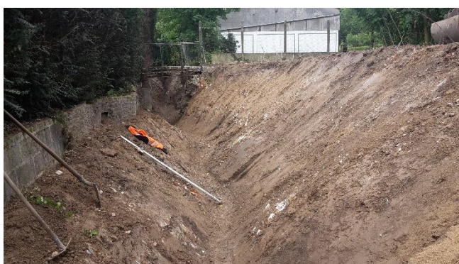
Reprofilage du lit en cours de création

Les travaux de reprofilage du lit se sont poursuivis de l'amont vers l'aval. Le lit du ru a été approfondi de 50 à 60 cm afin de retrouver la même cote de fond que celle du bras de l'Oise. Un tracé sinueux a été réalisé pour retrouver l'aspect d'un cours d'eau plus naturel, en décalant le lit légèrement en rive gauche. La berge de cette même rive a été talutée en pente plus douce afin de garantir sa stabilité. Le haut de la berge a ainsi été reculé de 1 m à 1,50 m conformément avec ce qui a été convenu avec le propriétaire.