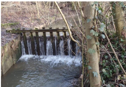
Bras de contournement avant démantèlement de l'ouvrage

Afin de restaurer la continuité écologique sur le bras de l'Oise et permettre la libre circulation des poissons et des sédiments, le seuil présent sur le bras de contournement du seuil principal a été démantelé, les grilles et vannages retirés. Préalablement, l'entreprise a réalisé une piste d'accès jusqu'à ce seuil dans une zone forestière après avoir obtenu l'accord du propriétaire.