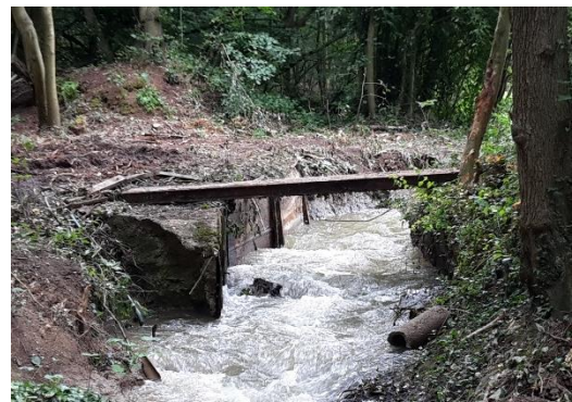
Après démantèlement de l'ouvrage