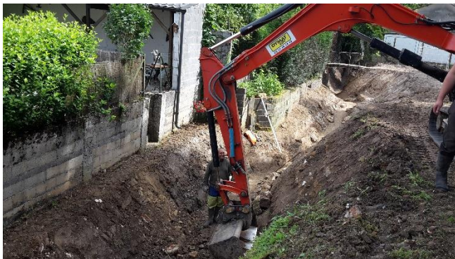
Travaux en cours plus en aval

Les travaux de reprofilage du lit et des berges se poursuivent la semaine 26 plus en aval jusqu'au pont. Le lit y sera également le plus sinueux possible, des banquettes seront créées en pieds de murs et la berge en rive droite sera talutée puis végétalisée.