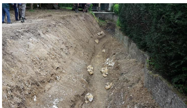
Nouveau lit sinueux

Des banquettes en pieds de berges de largeur différentes ont été créées, là où cela était possible, afin de permettre l'implantation des plantes héliophytes (iris, joncs, carex, ...). La hauteur des banquettes est calée sur la ligne d'eau du bras de l'Oise avec le débit moyen observé pendant les travaux. La hauteur d'eau sera d'environ 30 à 35 cm pour une largeur de lit de 1 m à 1,20 m. Cette hauteur d'eau variera en fonction des conditions hydrologiques du bras de l'Oise. Des pierres, déjà présentes sur site, ont été réutilisées afin de diversifier le fond du lit et recréer des habitats favorables à la vie aquatique.