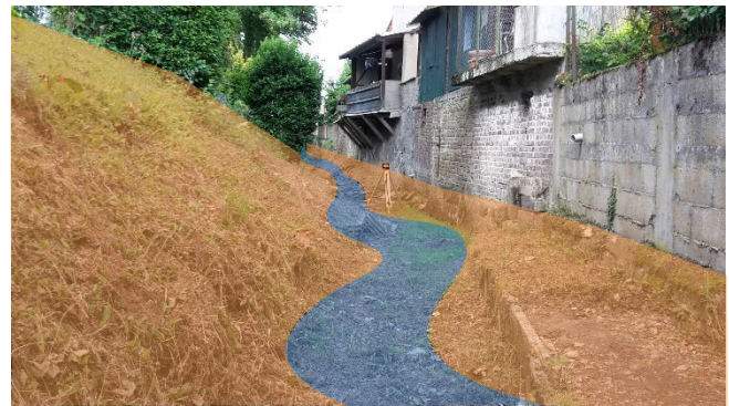
Schéma du reprofilage des berges et de la création d'un lit sinueux à réaliser