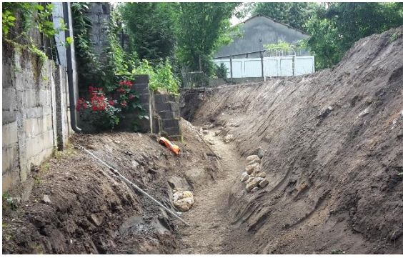
Lit sinueux et berges reprofilées