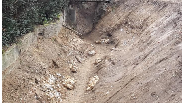
Banquettes et pierres en pieds de berges

Afin de restaurer la continuité écologique sur le bras de l'Oise et permettre la libre circulation des poissons et des sédiments, le seuil présent sur le bras de contournement du seuil principal a été démantelé, les grilles et vannages retirés. Préalablement, l'entreprise a réalisé une piste d'accès jusqu'à ce seuil dans une zone forestière après avoir obtenu l'accord du propriétaire.