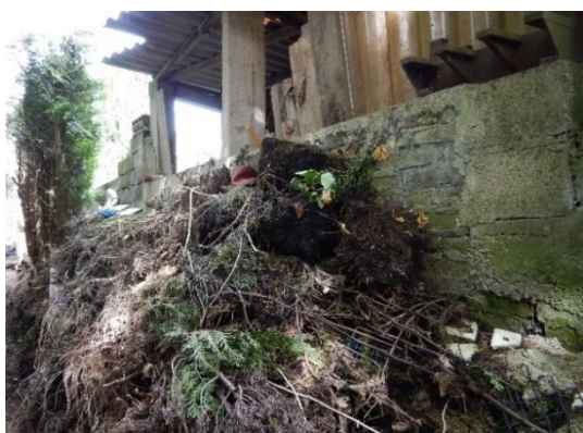
Amas de débris présents en rive droite avant retrait

Sur le tronçon le plus en amont, suite au reprofilage du lit et des berges, l'entreprise a commencé à ratisser et aplanir les berges afin de pouvoir les végétaliser avec un engazonnement spécial berge.