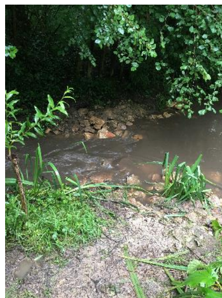
Suppression de l'obstacle et mise en place d'un micro-seuil