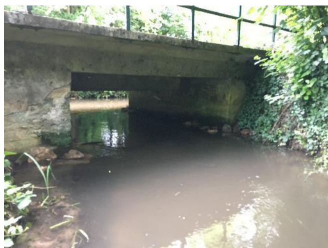
Création de banquettes sous le pont de l'ancienne voie ferrée