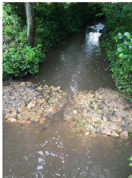
Mise en place d'un micro-seuil en aval du pont