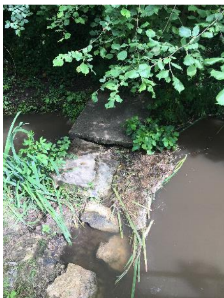
Obstacle à l'écoulement sur la Fausse Crise, avant travaux