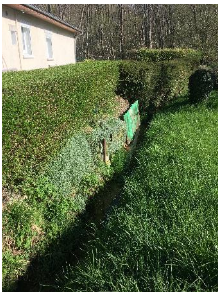
Berge hétéroclite avant travaux