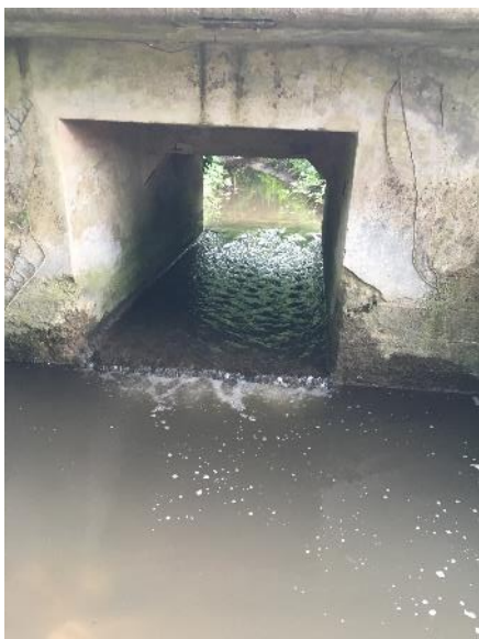
Radier du pont de l'ancienne voie ferrée