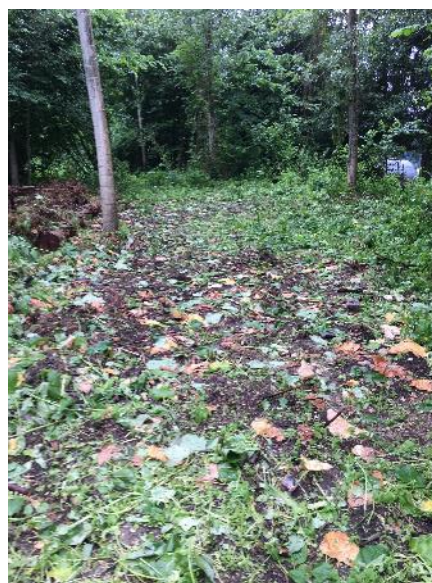
Fauche de la Renouée du Japon