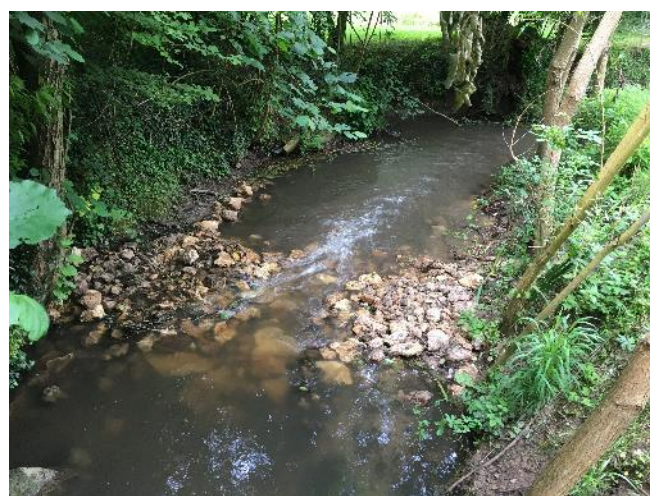
Mise en place d'un micro-seuil en aval du pont