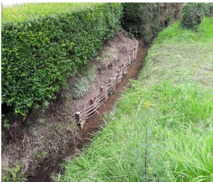
Réalisation d'un tressage et talutage de la berge