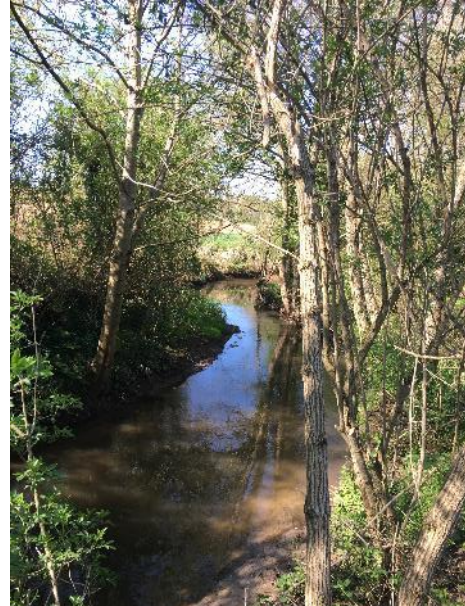
Photos tronçons 3.CRI.4 après travaux