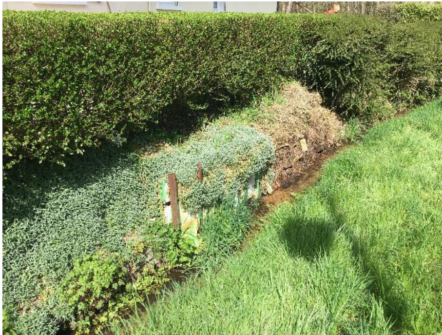
Photo de la berge à aménager