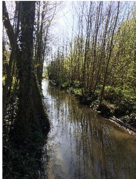
Photos tronçons 3.CRI.4 en cours de travaux