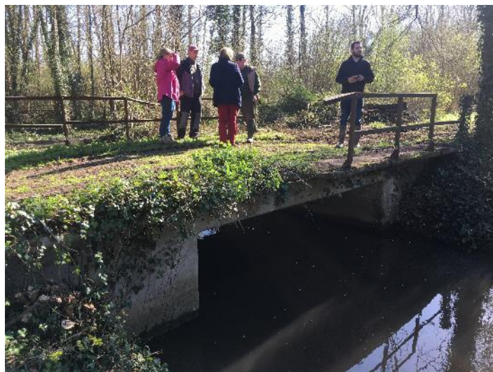
Photo de la passerelle