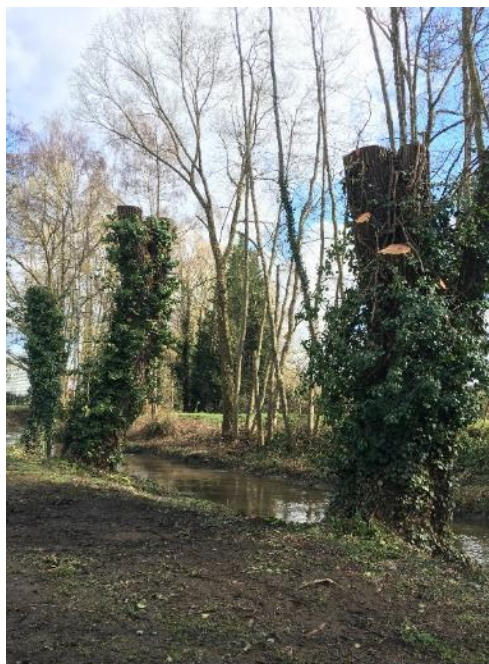
Tronçons 5.CRI.3 Etêtage de 3 saules (après travaux)