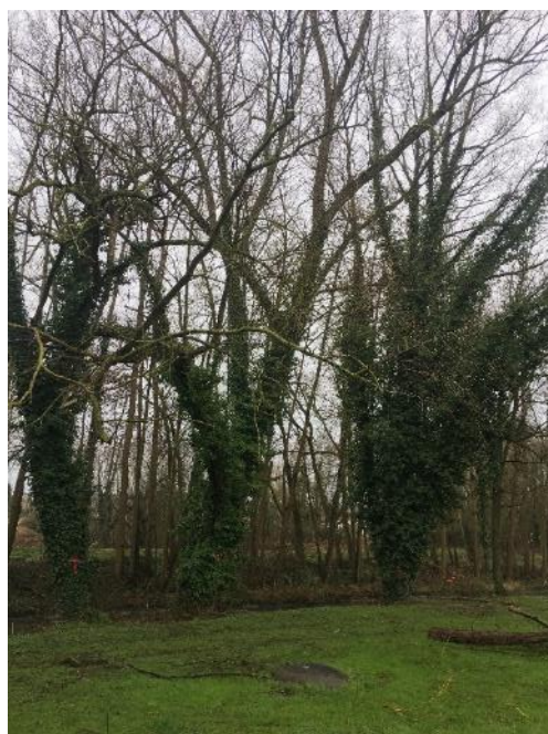
Tronçons 5.CRI.3- Etêtage de 3 saules (avant travaux)