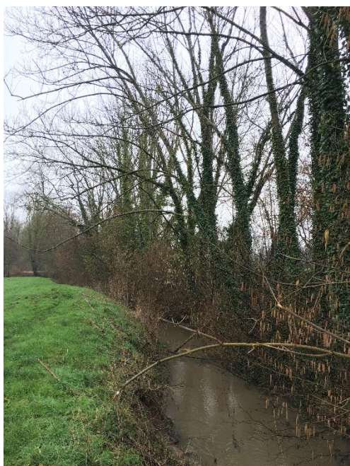
Avant travaux (Tronçon 2.CRI.2, parcelle N°80)