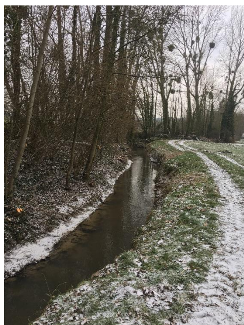
Après travaux (Tronçon 2.CRI.2, parcelle N°80)