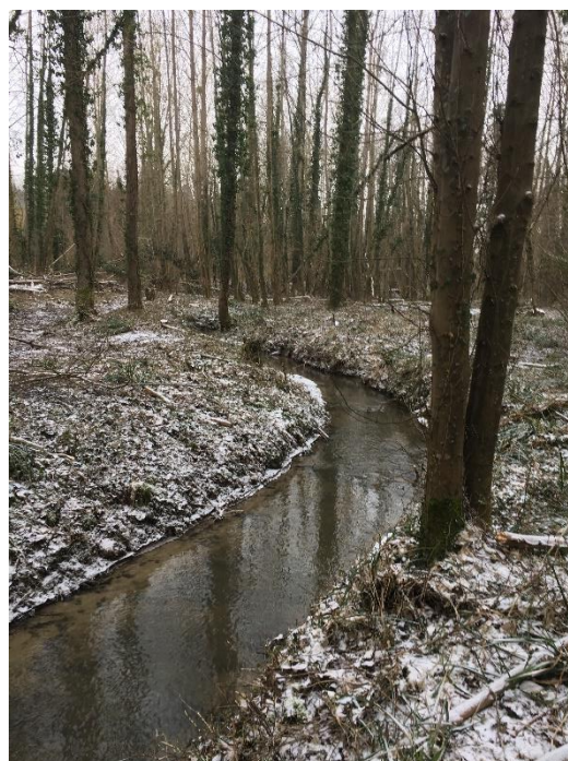
Tronçon 2.FCRI.2, (Peupleraie)