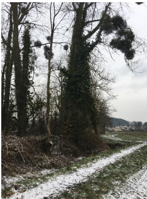
Abattage supplémentaire à réaliser (tronçon 2.CRI.2)