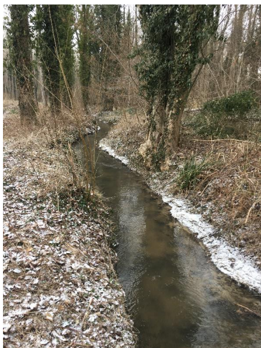
Tronçon 2.FCRI.2, (Peupleraie)