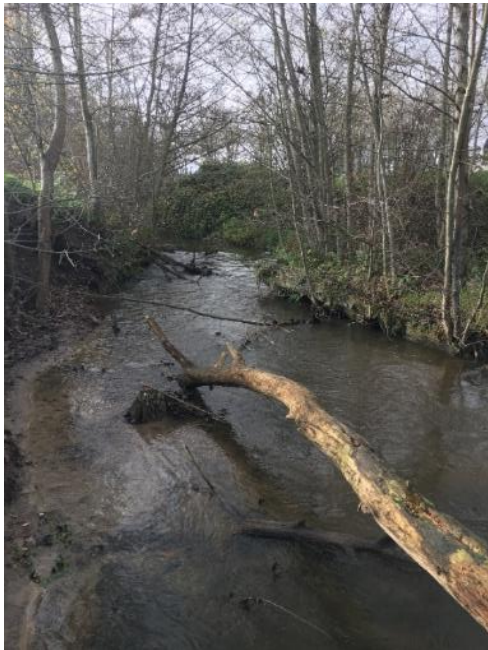
Avant travaux (embâcle)