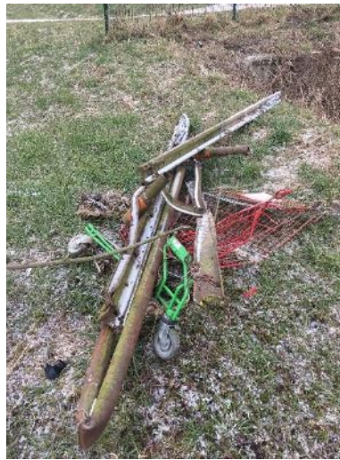
Déchets retirés du lit du cours d'eau