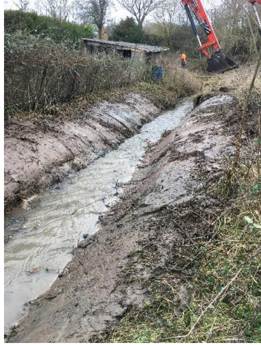
Retrait des tôles et travail des berges en pente douce

La plantation d'une ripisylve sera réalisée dans le cadre du Lot 3 du PPRE pour aider à maintenir les berges dans un premier temps et créer de nouveaux habitats dans un second temps.