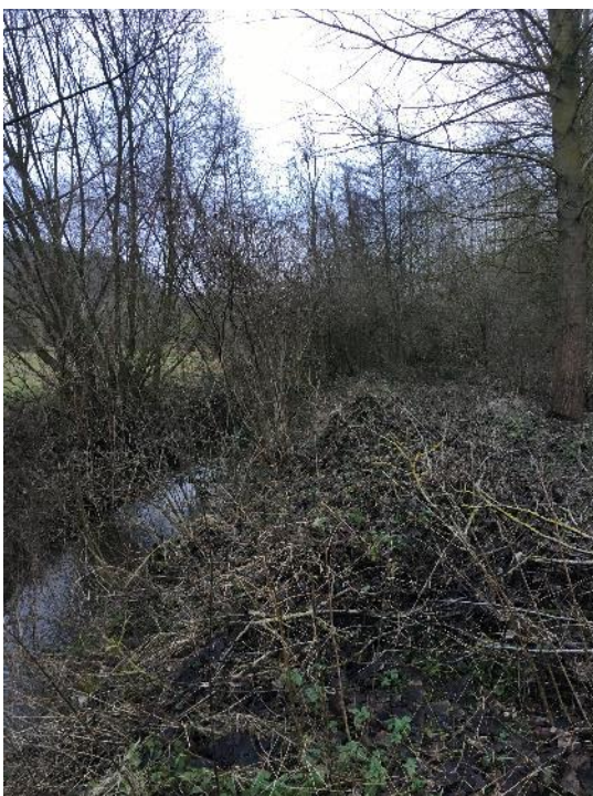
Tronçon en amont de Chacrise (CRI.1) avant travaux