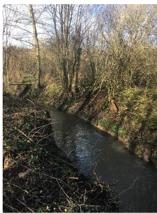
Tronçon en amont de Chacrise (CRI.1) après travaux