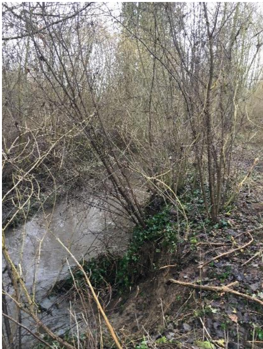
Tronçon en amont de Chacrise (CRI.1) avant travaux