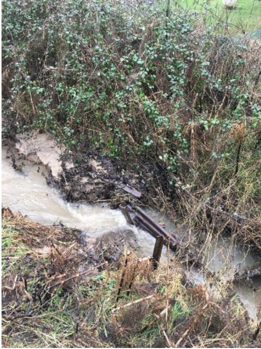
Aménagement en tôles dégradé en travers de la Crise, Parcelle N°B.536

La présence de tôles avait été constaté sur la parcelle N°B.536 au niveau de la commune de Launoy. L'entreprise FORETS ET PAYSAGES a réalisé les travaux comme l'attestent les photos ci-dessous :