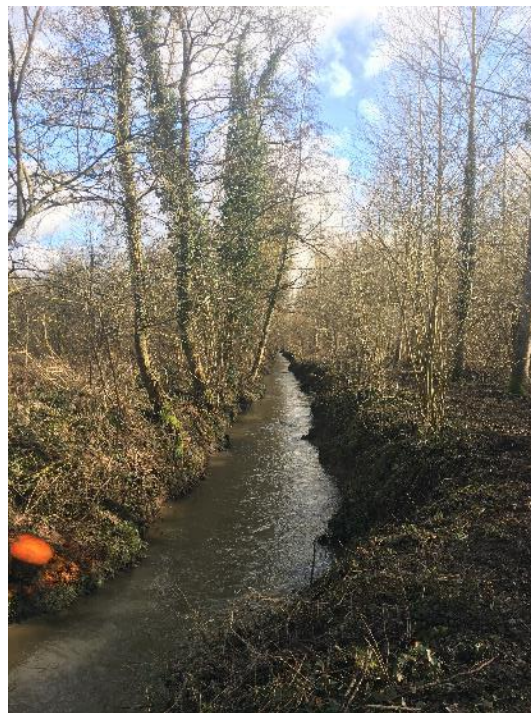
Tronçon en amont de Chacrise (CRI.1) après travaux