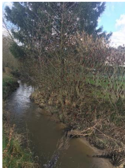
Foyer de sumac de Virginie, bourg de Chacrise