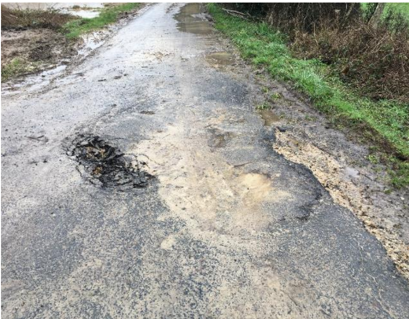
Affaissement de l'ouvrage, 15/02/2018