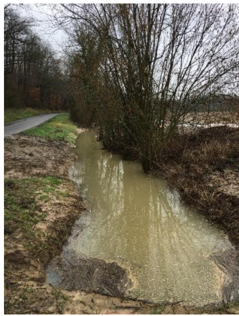
Stagnation des eaux en amont de l'ouvrage, 15/02/2018