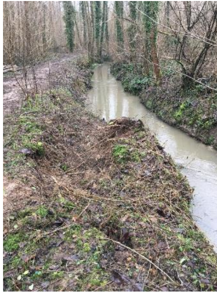
Souche d'arbre présent en travers de la rivière avec un risque d'encoche d'érosion