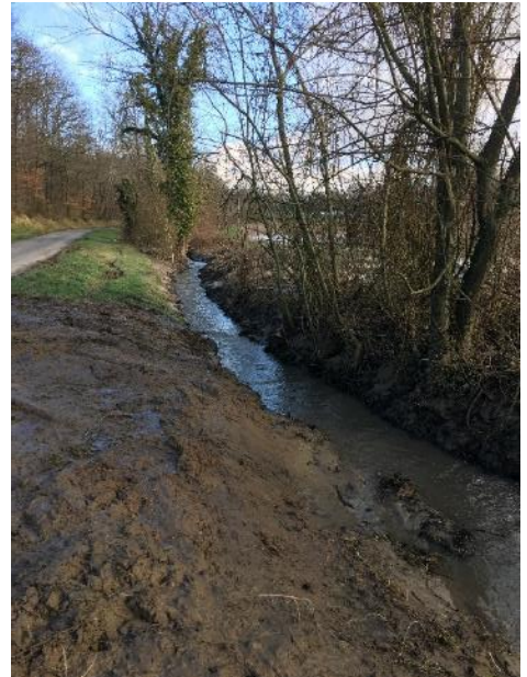
Travaux d'extraction des sédiments, 12/02/2018