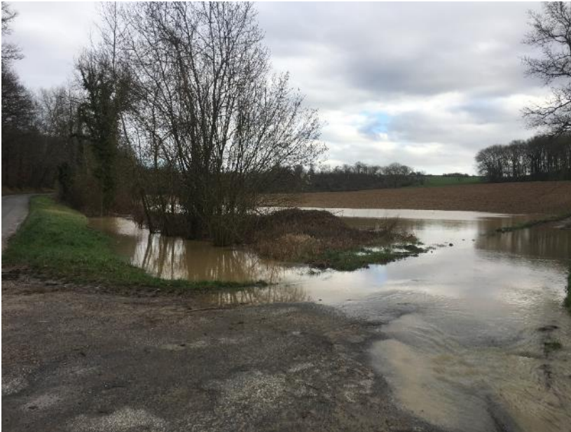
Débordement de la Crise sur un passage busé, parcelle de M. FELTES en amont de la ferme de l'Hermitage, 24/01/2018