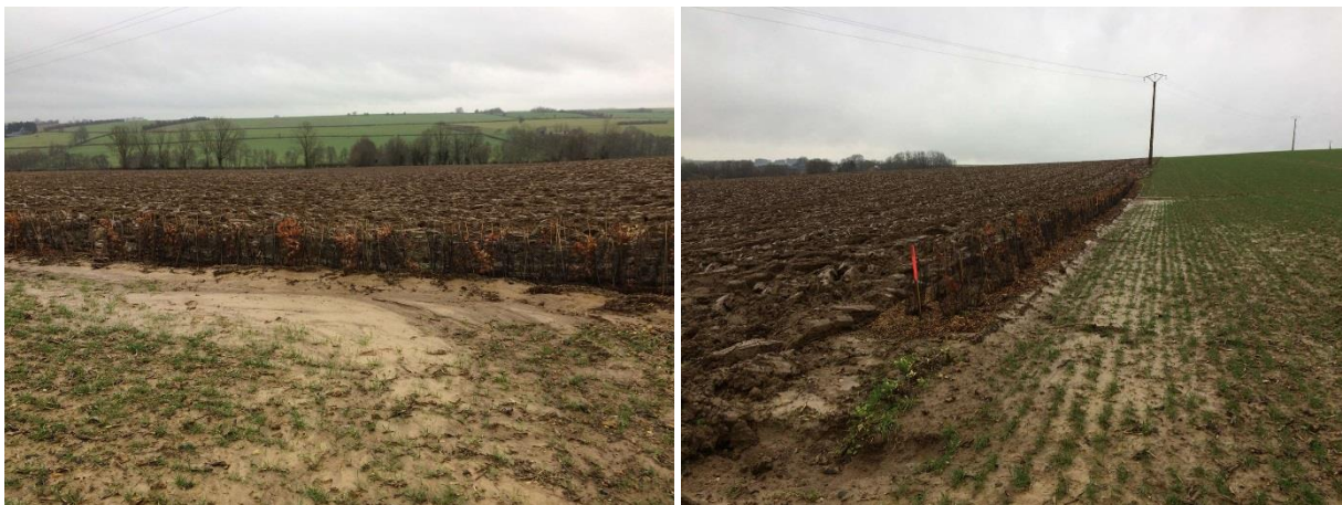
Vue sur les dégâts des haies 166 et 146 – redressement/repiquage des plants