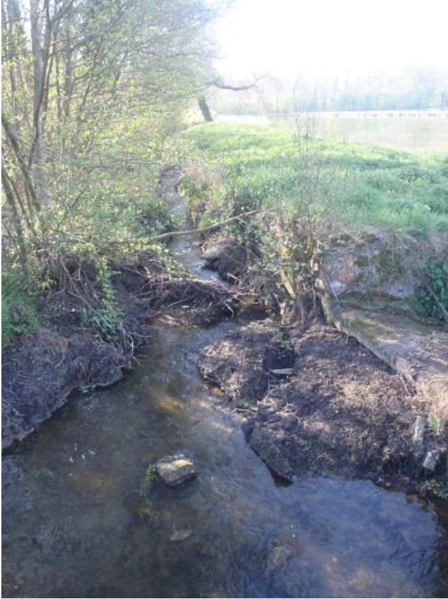
Tronçon amont seuil étangs de Muret-et-Crouttes avant travaux