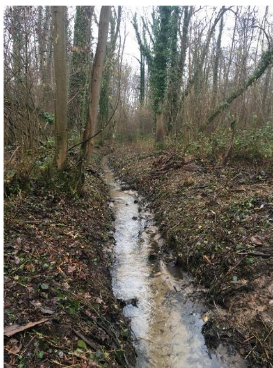
Débroussaillage sur les ronciers et sélection sur la strate arborée