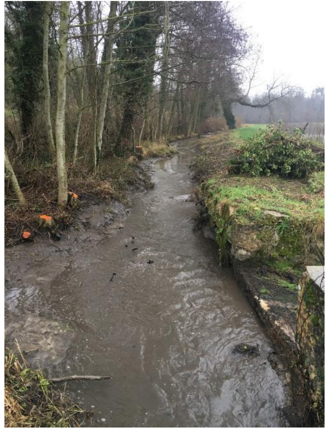
Tronçon amont seuil étangs de Muret-et-Crouttes après travaux