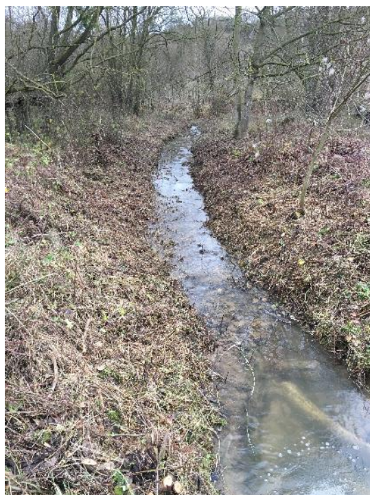
Débroussaillage sur les ronciers et sélection sur la strate arbustive