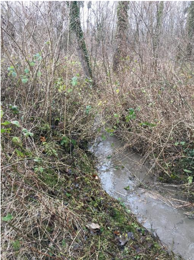
Tronçon LAU.3 avant travaux