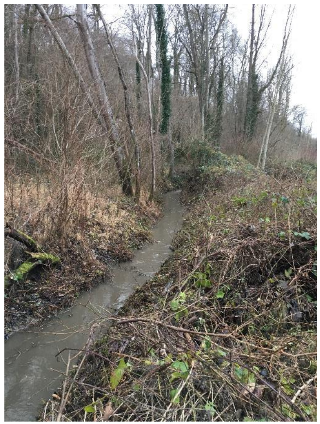
Tronçon LAU.3 après travaux