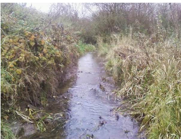
Entretien du tronçon RuMar