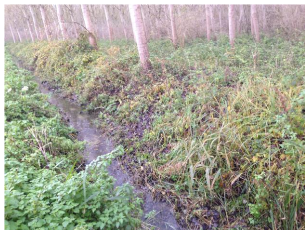
Entretien du tronçon PréVi