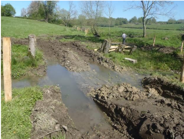
Emplacement d'un passage à qué