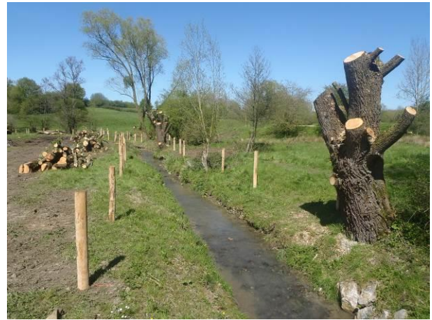
Saule têtard après élagage, pose de la clôture en cours