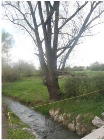
Saule blanc mûture, à éêter