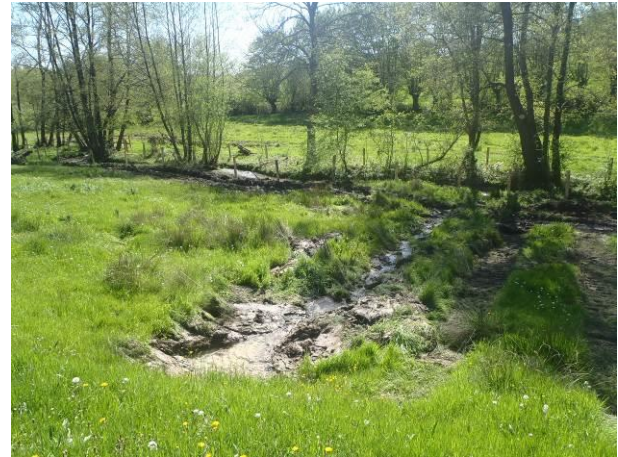
Emplacement de l'abreuvoir gravitaire