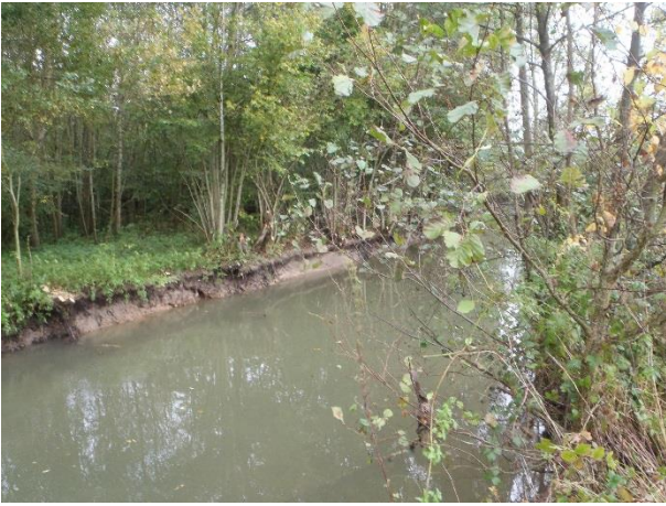
Entretien de la rivière Oise (OMBL)