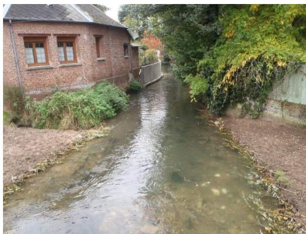
Double pieux fascine de saules à Séry-les-Mézières