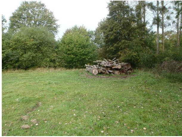
Abattage de peupliers