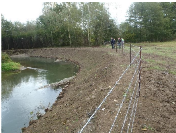
Peigne à Châtillon sur Oise